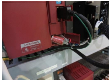
富士電機株式会社製 PLC