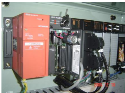
三菱電機株式会社製 PLC(Aシリーズ)